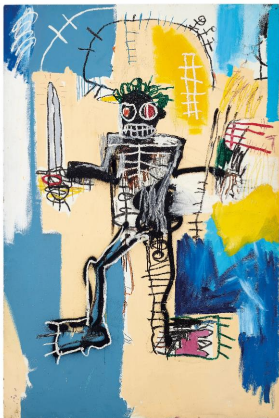
尚·米榭·巴斯奇亞 (1960-1988) 《戰士》

壓克力 油畫棒 噴漆 木板 183 x 122 公分 (72 x 48 英寸) 款識: Jean-Michel Basquiat 1982 (畫背) 1982 年作