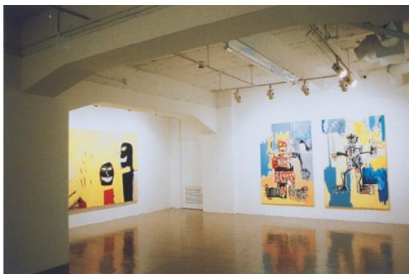
東京 Akira Ikeda 畫廊展覽場景： 尚·米榭·巴斯奇亞，1983 年，圖為（由左至右） 《無題（1982 年作）》及現作